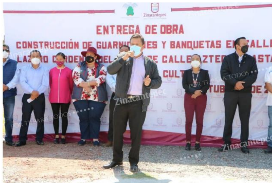
BENEFICIADOS VECINOS DE LA COLONIA LAS CULTURAS CON GUARNICIONES Y BANQUETAS

gob.mx/administracion2019/?s=fismdf+2020