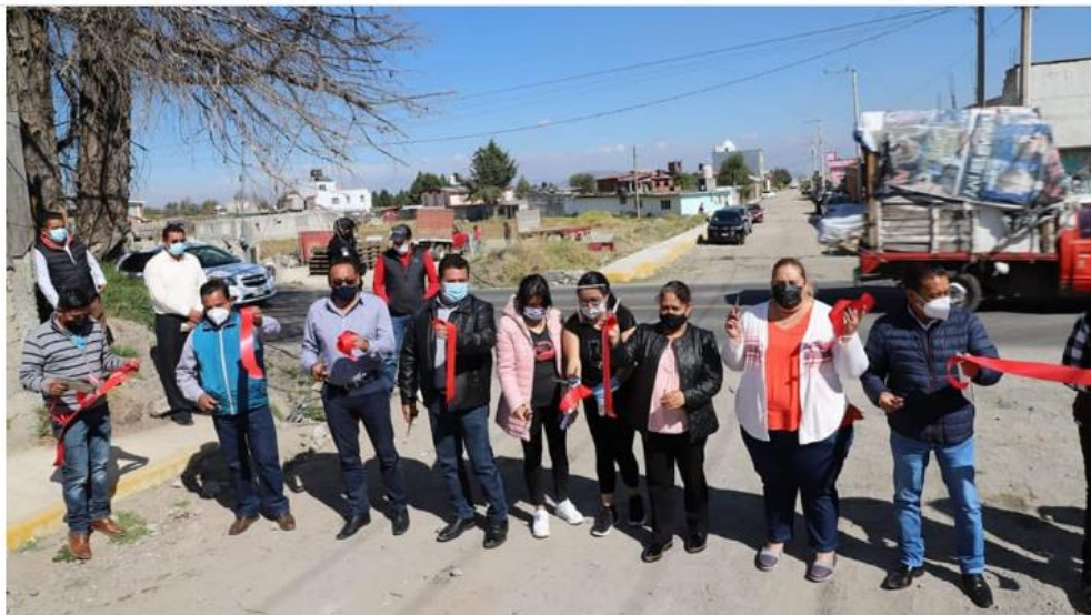
VECINOS DE LA COLONIA BENITO JUÁREZ GARCÍA BENEFICIADOS CON GUARNICIONES Y BANQUETAS

Admin – Acontecimientos Noticias- diciembre 15. 2020